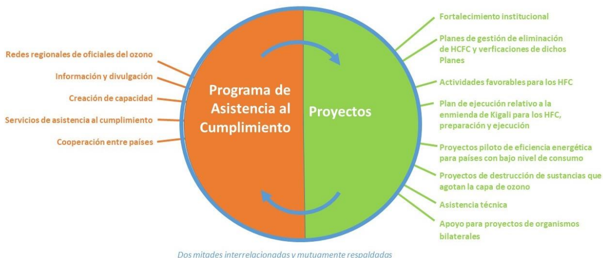
Figura 1: AcciónOzono y Programa de Asistencia al Cumplimiento (*)